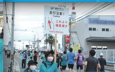
コース案内・誘導