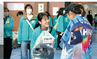
手荷物預かり・返却