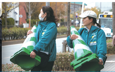
コース設営・整理