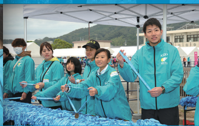
フィニッシュ会場